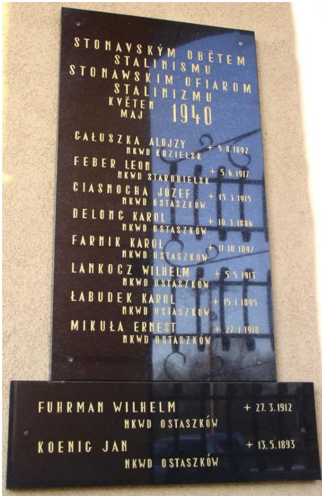
Tablica upamiętniająca ofiary NKWD, znajdująca się na ścianie budynku Urzędu Gminy w Stonawie