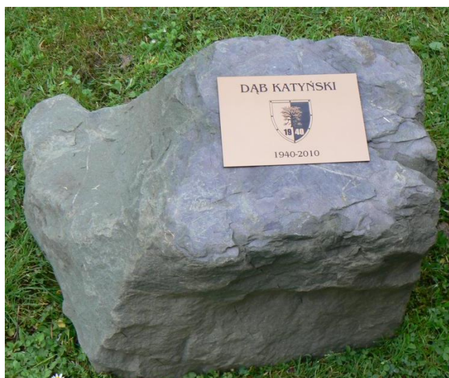
Dyplom i kamień z pamiątkową tabliczką

Obejrzałam także film „Katyń” - dzieło Andrzeja Wajdy. Najbardziej w pamięci utkwiły mi ostatnie sceny, kiedy młody oficer idąc na śmierć trzyma w ręku różaniec i powtarza jak mantrę słowa „i odpuść nam nasze winy, jako i my odpuszczamy naszym winowajcom”. Gdy kona, jego dłoń wciąż mocno do góry trzyma różaniec. Jest to scena bardzo przejmująca, symboliczna i powiedziałabym, ponadczasowa. Nie może być prawdziwego pojednania bez ukazania prawdy i rozliczenia przeszłości. Pojednania, ale nigdy zapomnienia! Wszędzie tam, gdzie z ustrojów wyrugowano Boga, kończyło się na masakrycznym ludobójstwie. Historia, jak mówi przysłowie, lubi się powtarzać. Dlatego trzeba ją znać, aby w przyszłości już nigdy nie dopuścić do takiej bestialskiej zagłady milionów istnień ludzkich.